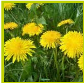
Paardenbloem Ontstekingsremmend & goed voor lever- en nierfunctie