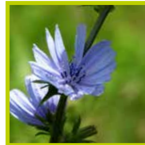
Chicorei Negatief effect op maagdarmwormen