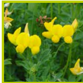
Rolklaver Negatief effect op maagdarmwormen