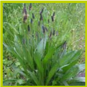
Smalle weegbree Antibacteriële werking & goed voor lever- en nierfunctie

Bron: Geerts, R., & Korevaar, H. (2014). Kruidenrijk Grasland en; van Eekeren, N., Beekman, A., Sobry, L., & Govaerts, W. (2012). Kruiden en de mineralenvoorziening van melkvee. Biokennis bericht Zuivel en rundvee 29.