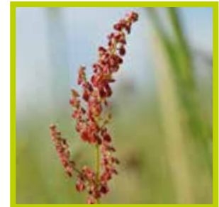
Veldzuring Voorkomt trommel- zucht